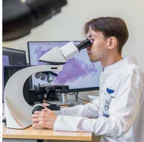
▲ ЦАОП Боткинской больницы